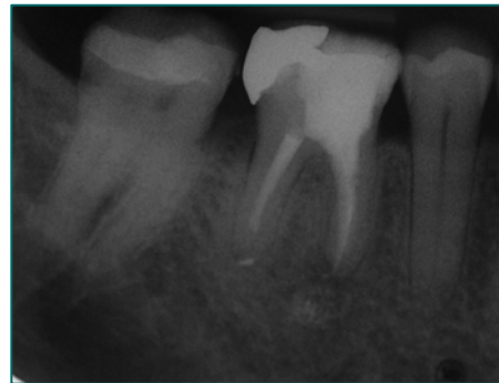
Abbildung 5: Weitgehend abgeschlossene, röntgenologisch knochendichte Ausheilung bei klinischer Beschwerdefreiheit nach Ausheilung des bakteriellen Infektes

Wie aber soll eine apikale Ostitis, die ja nichts anderes als eine besonders benigne (Früh-)Form der Osteomyelitis darstellt, nach Maßgabe der als modern auftretenden zahnmedizinischen Wissenschaft behandelt werden? Indem große Mühe darauf verwendet wird, gerade keinen Zugang zum apikalen Infekt zu schaffen und die Desinfektionsmittel gerade