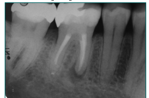
Abbildung 3: Zahn 46 unmittelbar vor Revision der mesialen Wurzel bei Zustand nach fistelnder Exazerbation

Die Abbildung 3 zeigt einen Molaren, der wenige Jahre nach der Behandlung durch einen ausgewiesenen Spezialisten für Endodontie fistelnd exazerbierte und vom selben Behandler revidiert worden war, ohne dass es gelang, das fistelnde Granu-