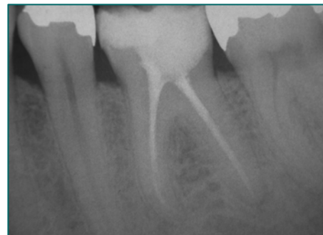
Abbildung 1: Kontrollaufnahme nach technisch einwandfreier Wurzelkanalbehandlung an Zahn 36 mit diskreter periapikaler Aufhellung an der distalen Wurzel

Das folgende Fallbeispiel soll dies verdeutlichen: